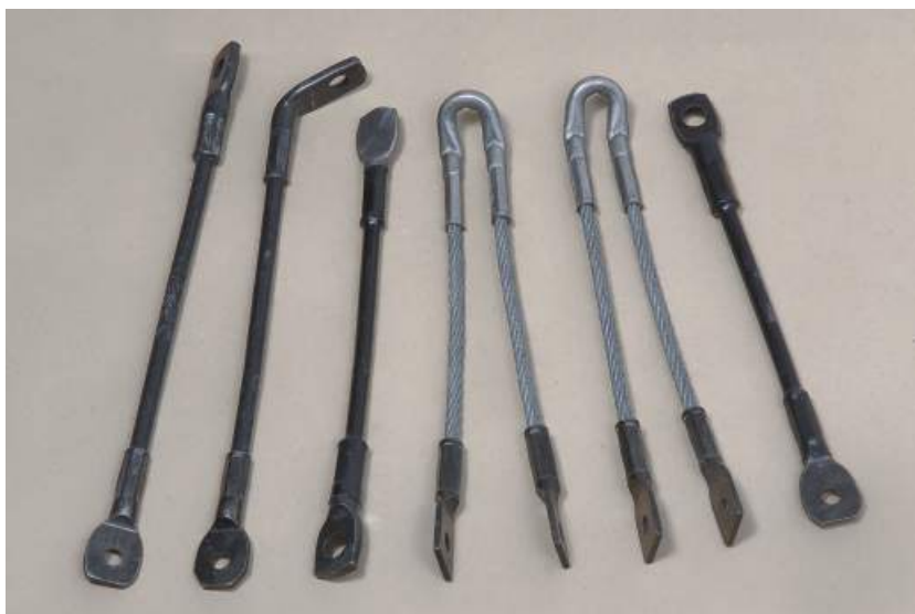
Sajle - Razno - Sajle za kamin - Sajle za ogradu - Sajle za teretanu