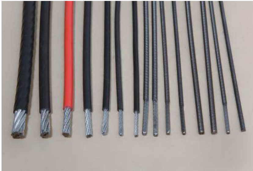
Plastificirane sajle i kilometar sajle